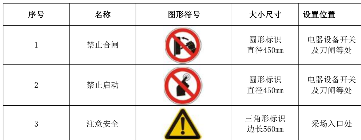
表 3-9 矿山安全标志表