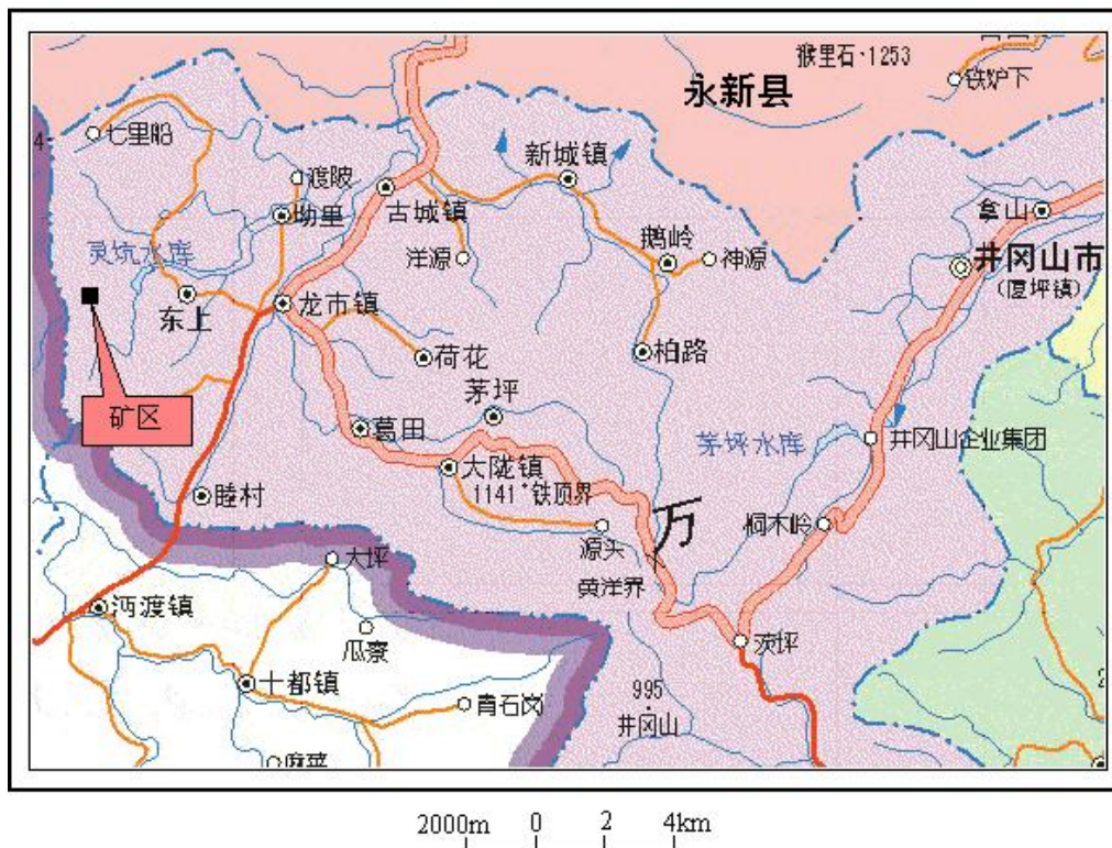
图 2-1 矿区位置交通图

2021 年 11 月始，矿山按《安全设施设计》的要求进行了基建工作，2024 年 10 月进行了试生产，试生产矿山安全设施运行基本趋于正常。