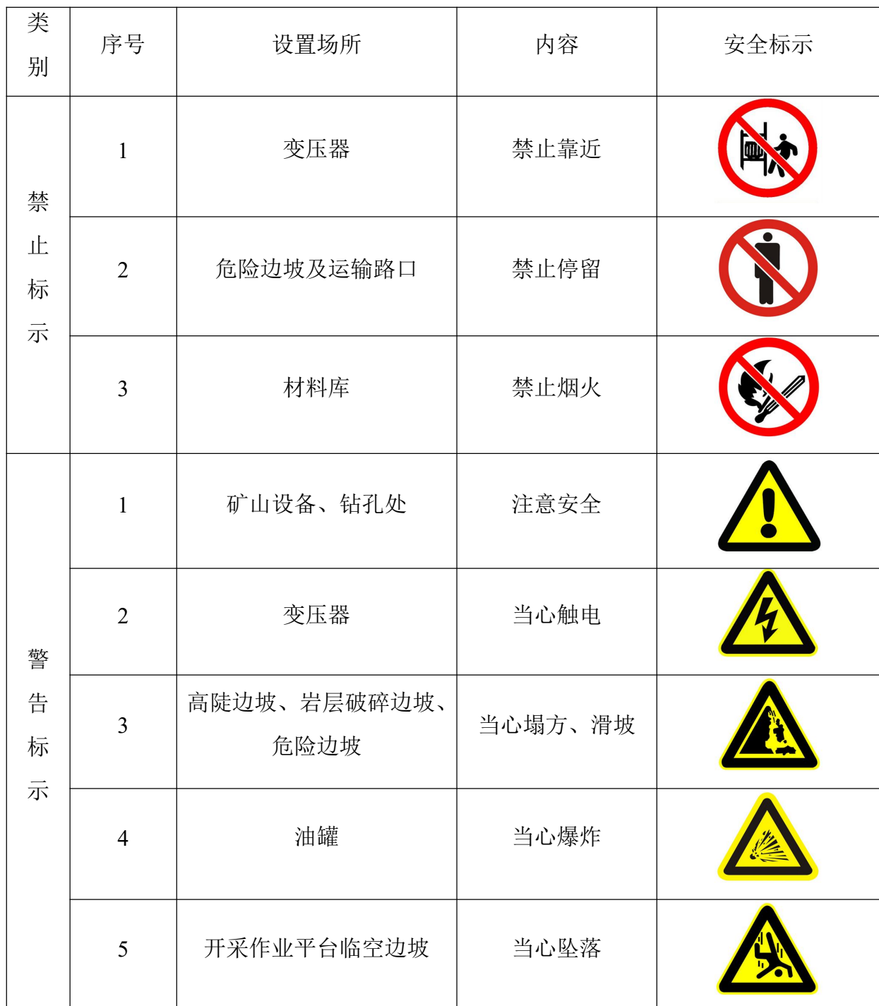
表 3-9 矿山安全标志表