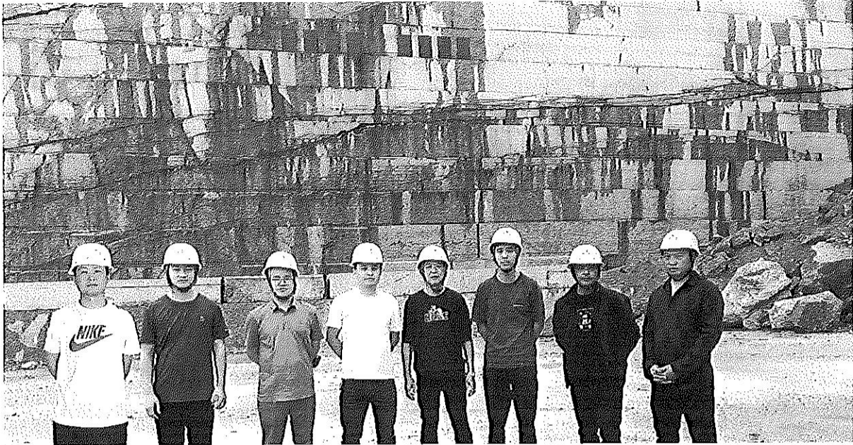
评价人员现场合影