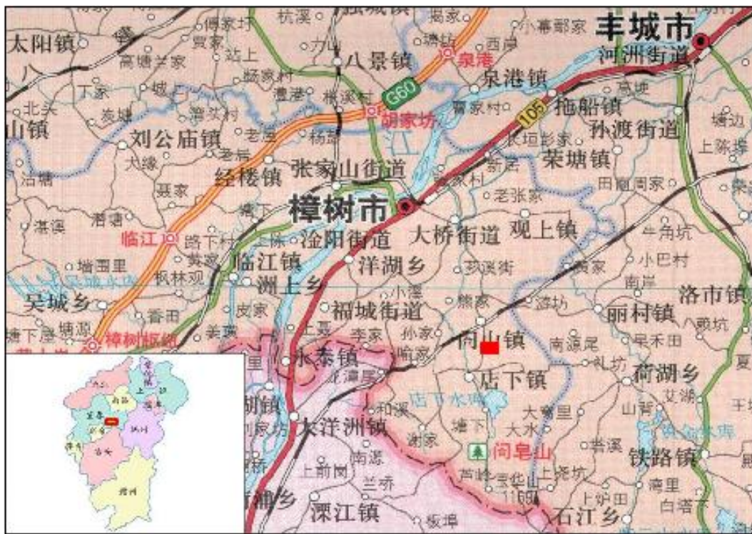
图 2-1 交通位置图

57' 45.47"；矿区中心地理坐标（2000）：东经 115° 36' 34.903"，北纬 27° 57' 38.903"；矿区中心点平面直角坐标（2000）：3095141.804，38658401.664；矿区交通位置如图 2-1。