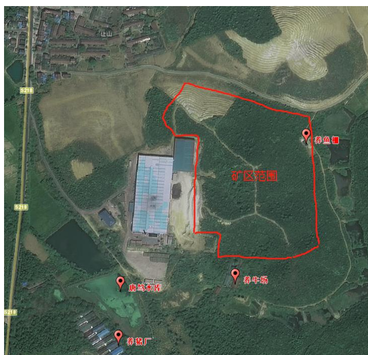
图 2-2 周边位置关系图

除上述外矿区300m范围内无民居，无需要保护的通讯线路、风景区及其它建（构）筑物，500m范围内无高压线、电力、水利等设施，1000m可视范围内无铁路、高速公路、国道、省道。